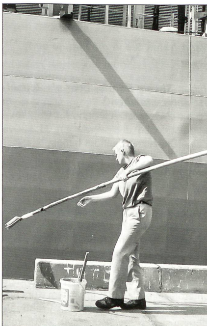
Das Schiff muss ständig frisch gemalt werden.

Als ich auf dem Schiff angefangen habe, war es schon gewöhnungsbedürftig. Ich