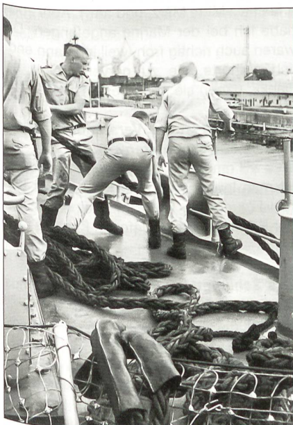
Die Taue werden eingezogen – ein Job für die Männer und Frauen des Oberdecks.

Tja, ich habe mir gedacht, dass ich zu denen gehen werde, die sich zuerst melden. Das war dann die Marine und jetzt bin ich dabei.