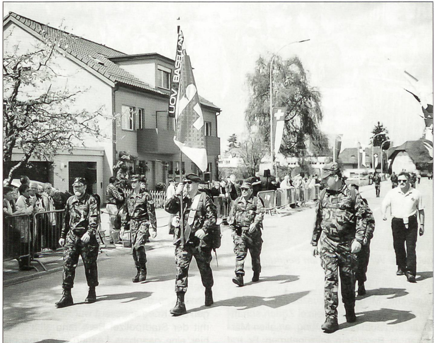
Die Marschgruppe des UOV Baselland sauber ausgerichtet.