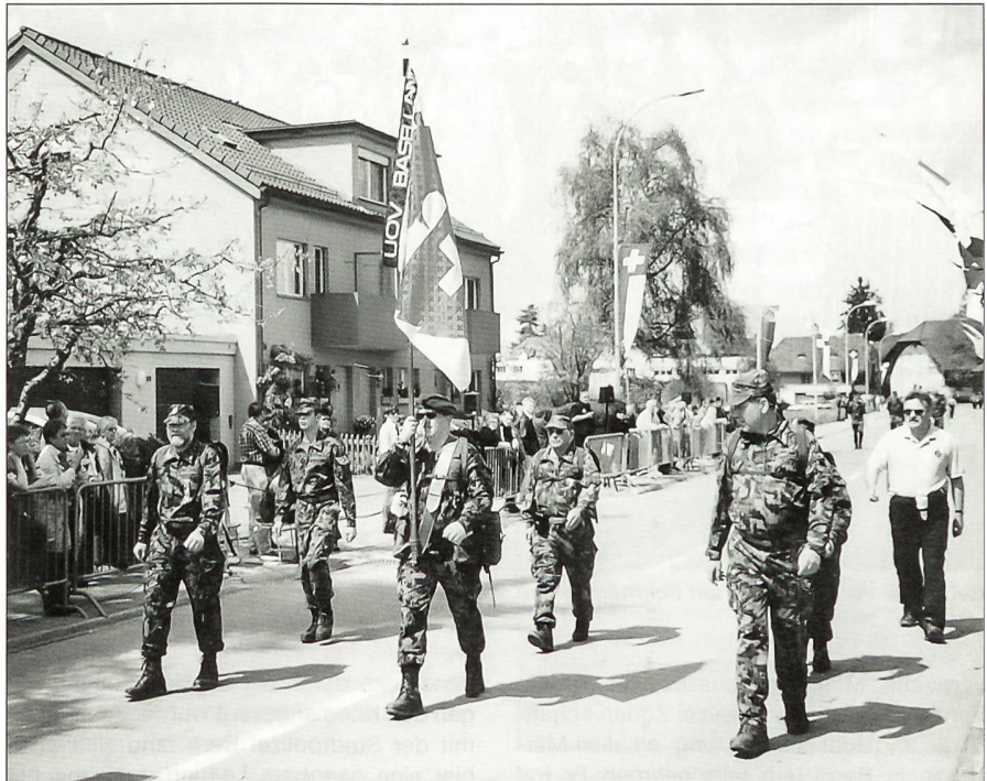
Die Marschgruppe des UOV Baselland sauber ausgerichtet.