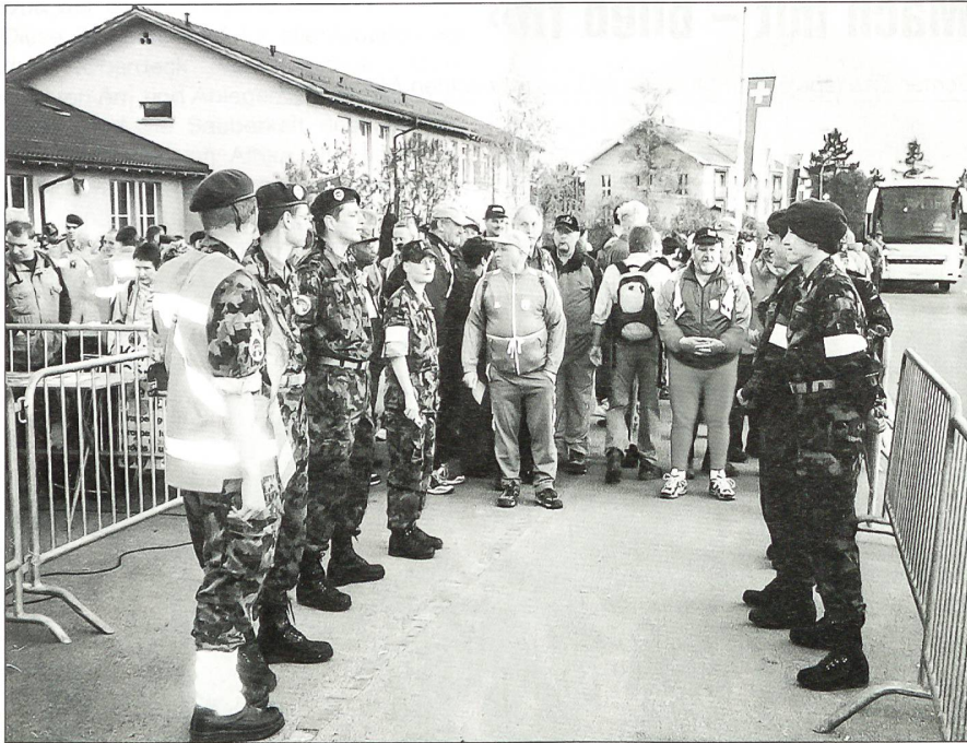
Gedränge vor dem Start am Sonntag zu den 20 km.