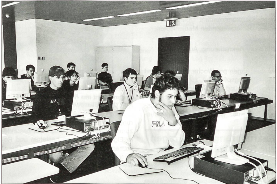
Die Rekrutierenden im Computerraum beim psychischen Vettertest. Beantworten müssen sie innert zwei Stunden rund 480 verschiedenste Fragen mit 1 oder 0.

Die Verwaltung rechnet mit rund 15 000 Übernachtungen und 60 000 Mahlzeiten pro Jahr. Für die Durchführung der sportlichen Tests liess der Zweckverband eine Traglufthalle erstellen, die er dem VBS vermietete. Die Benützung des Zentrums durch Dritte, wenn nicht für Militärzwecke belegt, sei gesichert, vervollständigt Jakob