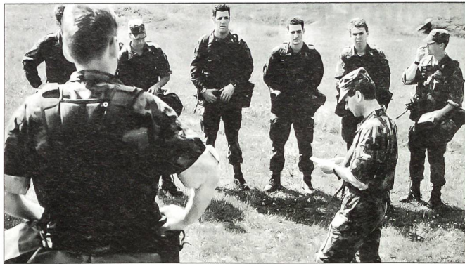
Unteroffiziere bilden Unteroffiziere aus.

-graden soll primär eine klare Abgrenzung der entsprechenden Verantwortungs- und Kompetenzbereiche ermöglichen.