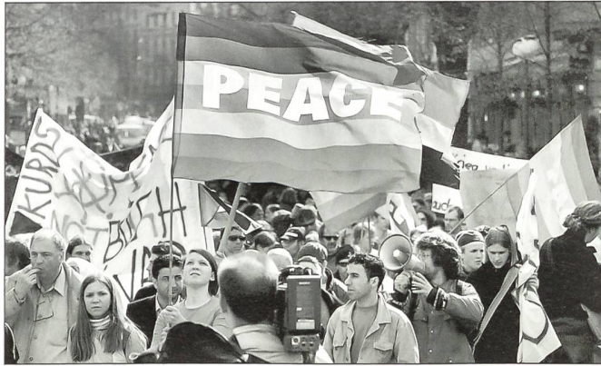
Auch die Schweizer beteiligten sich als «Mitläufer».

in der Regel nur beendet werden, wenn sich ein paar handlungsfähige Rechtsstaaten zur Tat aufraffen!