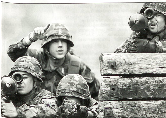
Eine ernst zu nehmende Verteidigung braucht Investitionen.

der Schweiz sowie im übrigen Europa. Man konnte damals zu Recht schreiben – was wir taten –, «wer jetzt demonstriert, lehnt sich auf gegen die UNO, das Selbstbestimmungsrecht der Völker und die Entscheidungen demokratisch gewählter Regierungen... Wenn Briten und Amerikaner, aber auch Russen, zwischen 1940 und 1945 das befolgt hätten, was man in der Schweiz dieser Tage auf Transparenten lesen konnte, nämlich dass der Krieg noch nie Probleme gelöst habe, wären wir heute alle Untertanen einer nazistischen Ordnung.» (Basellandschaftliche Zeitung 18.1.1991).