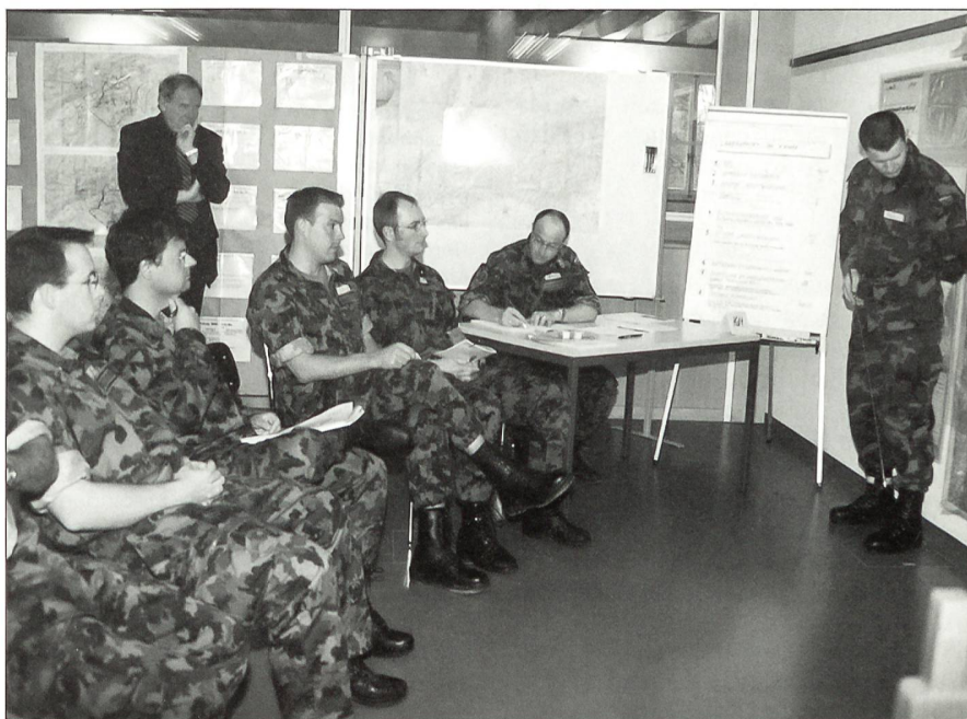
Praxisnahe Ausbildungslehrgänge konnten mitverfolgt werden.