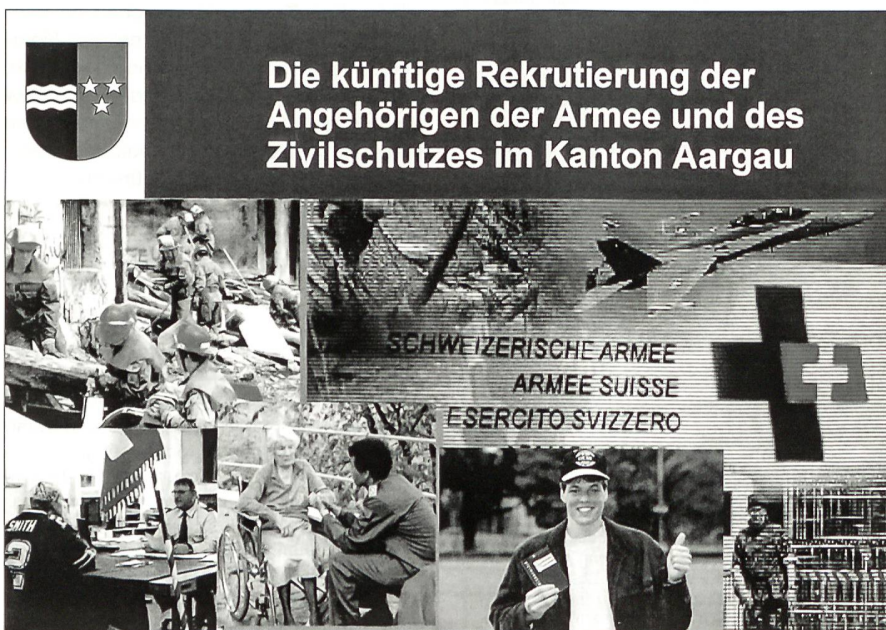
Die zukünftige Rekrutierung.