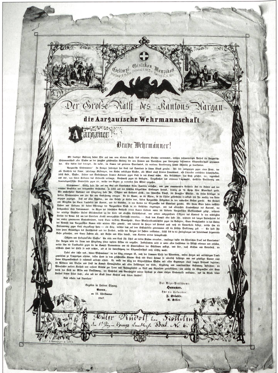
Die aargauische Wehrmannschaft.

Über 10 000 Jahre alt sind die Zeugen der Siedlungsgeschichte im Aargau. Von den Helvetiern, die Teil der keltischen Volksgruppe waren, erzählen die Siedlungsspuren. Julius Caesar stoppte das Volk bei Bibracte und veranlasste es, das Land wieder zu besiedeln. Wenig später erfolgte die Besetzung des Raumes durch römisches Militär. Um 45 v. Chr. wurde die römische Kolonie in Augst errichtet. Bei Windisch bauten die Römer eine erste Militärstation und im Jahre 17 n. Chr. das Legionslager Vindonissa. Dieser strategisch wichtige Militärstützpunkt am Zusammenfluss der drei grossen Flüsse stellen ein wichtigen Verkehrsweg dar. Während 300 Jahren herrschte unter den Römern Frieden und Sicherheit sowie wirtschaftlicher Wohlstand. Die Hinterlassenschaft der römischen Siedler und der Kelten kann man noch heute bewundern. Neben Augusta Raurica sind vor allem die zivilen Siedlungen wie Zurzach, Windisch, Lenzburg und Baden zu erwähnen. In Baden wurden vermutlich erstmals die Thermalquellen gefasst.