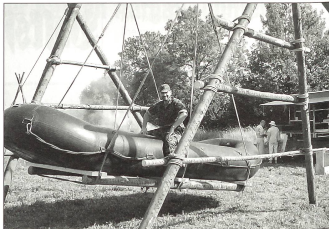
Im Ernstfall auf dem Wasser anzutreffen.