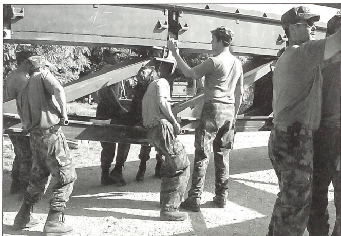
Anlässlich «Besuchstag» des G Bat 5 im Mittelland.