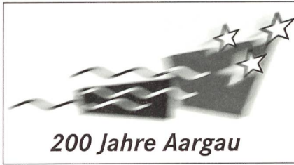
200 Jahre Aargau

Der Aargau, als eigenes Staatswesen, setzte sich aus den drei Verwaltungseinheiten der Helvetischen Republik, den Kantonen Aargau, Baden und Fricktal zusammen. Aber der historische Raum Aargau kann natürlich weit länger zurückverfolgt werden. Durch die eindrücklichen