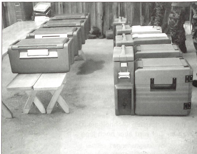
Die neuen Thermo-geräte sind für das Nachtessen bereit.