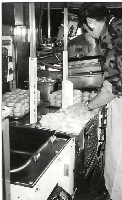
Fleischkonserven werden zum Anbraten für das Nachtessen vorbereitet.