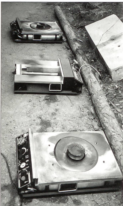
Die Nachfolger des Benzinvergaserbrenners.

Das Konzept des Projektes Verpflegung XXI deckt alle Prozesse von der Planung der Verpflegung bis zur Entsorgung ab. Die Zuteilung von weniger Küchenpersonal führt natürlich zu einem Leistungsabbau. Dieser Abbau ist nicht in der Qualität der zubereiteten Mahlzeiten zu finden, sondern in der Umlagerung von eingekaufter Dienstleistung. So werden beispielsweise kaum noch Kartoffeln geschält. Diese bietet der frische, saisonale Markt bereits geschält an, oder es werden vorbehandelte handelsübliche Produkte eingesetzt, so wie dies die heutigen Köche im Beruf lernen und bei der täglichen Arbeit einsetzen.