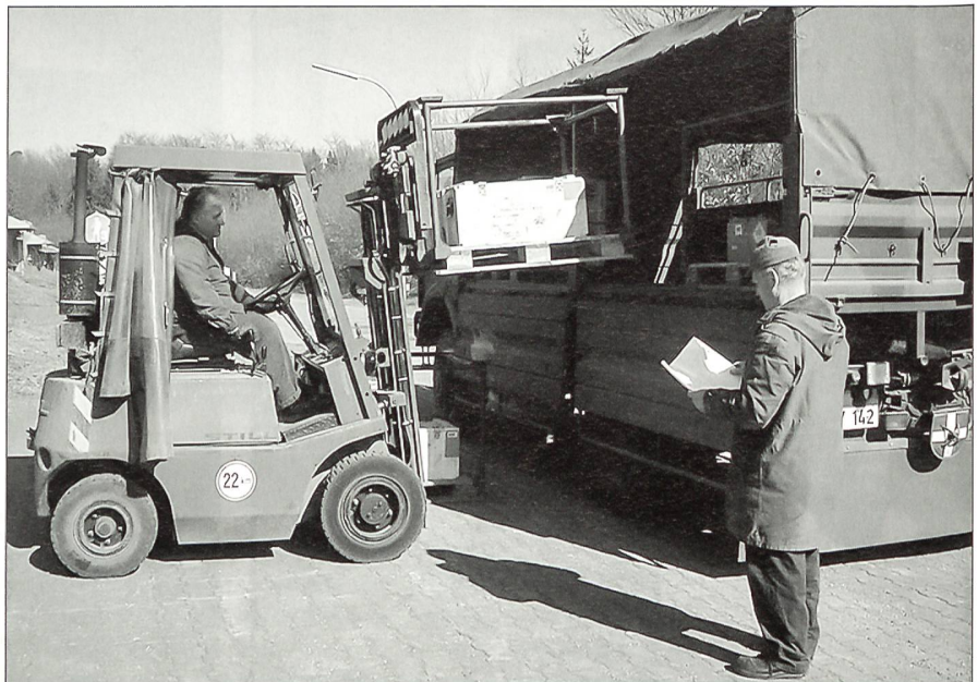
Entladung mit Gabelstapler.

Im Herbst 1972 wurde der Lagerbereich fertig gestellt. Der Verwaltungsteil bestand damals nur aus drei Baracken: zwei Verwaltungsbaracken und einer Sozialbaracke. Die infrastrukturellen Probleme des Depots Landsberg forcierten die Fertigstellung des Depots, und die Befüllung begann unter immensem Druck von «oben»