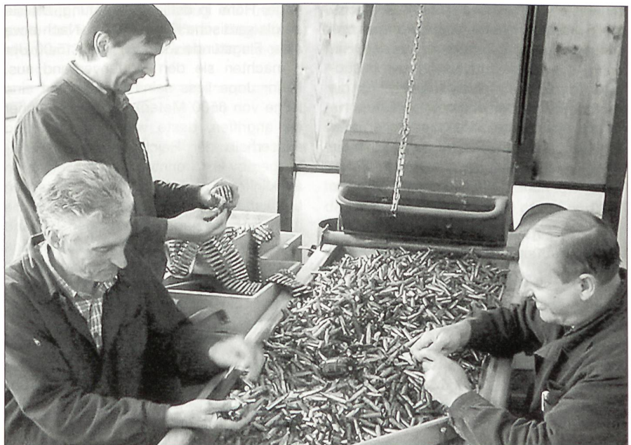
Der Rücklieferungsbezirk heute – es wird immer noch von Hand gesichtet.

Das Depot unternahm erhebliche Anstrengungen bei der Erstellung von Brandschutzplänen, der Auswahl von freiwilligem Personal zur Aufstellung einer Brandschutzgruppe und in der Vorbereitung von internen Übungen. ☒