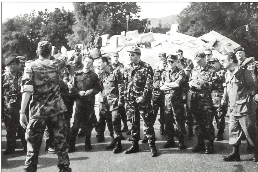
Ausländische Militärdelegationen bei der Information über die Arbeit der Rttg Trp.