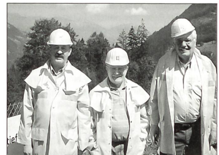
Alle Besucher wurden mit einer Schutz- bekleidung ausgerüstet.

Im Anschluss an diese interessante Information ging es in die Unterwelt, um das Gehörte und im Film vorgetragene an Ort und Stelle, das heisst möglichst live zu erleben. Vorerst wurden wir, wie es sich bei einem solchen Baustellen- besuch gehört, mit Helm und Schutzkleidung ausgerüstet. In Gruppen aufgeteilt, ging es da- nach mit Shuttlebussen in den Untergrund. Dass die Tunnelarbeiter bei viel Staub und recht hohen Temperaturen arbeiten müssen konnten wir live erleben. Einige Kameraden kamen recht ins Schwitzen. Auch der vorhandene dauernde Lärm darf nicht unterschätzt werden. Die Luft muss laufend umgewälzt bzw. erneuert werden, was den ständigen Betrieb einer ausreichenden Ventilation bedingt. Der Ausbruch des Felsma- terials bedingt einen Abtransport des Materials einerseits durch Förderbänder oder Transport- fahrzeuge, die ebenfalls wieder einen recht gros- sen Lärm verursachen. In rund 1000 m unter Boden verliessen wir die Fahrzeuge, um per Fussmarsch einige interessante Arbeitsstellen