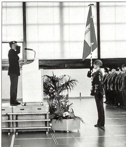
«Melde Entlassungsbataillon ab!»

In der regierungsrätlichen Ansprache kam auch der bevorstehende Wechsel zur Armee XXI zur Sprache. «Einiges, das man mit der Armee 95 abgeschafft hat, wird wieder eingeführt. Einiges wird aber nicht in die Armee XXI überführt und somit bald