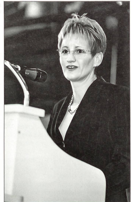
«In einer unsicheren Welt Sicherheit schaffen», Regierungsrätin Sabine Pegoraro ermahnt die abtretenden Wehrmänner.

Traditionellerweise wurde nun des Gefechtsmenü der Schweizer Armee serviert und Baselbieter «Soldate Wy» ausgeschenkt. Bald gab man sich erstmals selbstständig Tenü-Erleichterung, und die