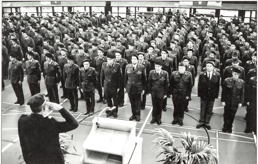
Dem Kreiskommandanten wird das Bataillon zur «Entlassung bereit» gemeldet.

«Vor 40 Jahren wurden mit dem Wechsel zur Armee 61 letztmals Armeemitglieder im Alter von 60 Jahren aus der Wehrpflicht entlassen. Vor genau 10 Jahren wurde mit der erstmaligen Entlassung von 42-Jährigen die Umsetzung der Armee 95 gestartet, und schliesslich erfolgt in den kommenden drei Jahren die Reduktion der Militärdienstpflicht bis zum 30. Altersjahr.» Mit dieser Darlegung der Verjüngung der Armee eröffnete Oberst Martin Büsser die Entlassungsfeier. «Auch ausserhalb der Armee haben seit Ihrem Geburtsjahr 1961–1964 viele Entwicklungen und Veränderungen stattgefunden», wandte sich der Kreiskommandant an das Entlassungsbataillon. «Vieles, was vor rund 40 Jahren noch Usanz war, gilt heute nicht mehr, andererseits haben wir heute Errungenschaften, die zu Beginn der Sechzigerjahre noch nicht denkbar gewesen wären.» Jene Zeit war in der Schweiz von einem explosiven Wirtschaftswachstum geprägt. Man redete von einer überhitzten Konjunktur. Der Kanton Basel-Landschaft verzeichnete damals während mehrerer Monate keinen einzigen Arbeitslosen, und etliche der an-