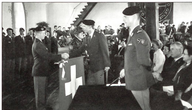
Der wichtige Handschlag über der Schweizer Fahne. Ab jetzt Offizier!

Die DHU kommt beim Waffenplatz der Genie in Brugg vorbei. Und wie der Name schon sagt, muss hier eine Brücke gebaut werden. Auf dem speziellen Ausbildungsplatz Stäglerhau muss in exakt vorgeschriebener Zeit die feste Brücke 69 mit Unterspannung eingebaut und befahrbar errichtet werden. Hier betreten die eingeladenen Angehörigen der Aspiranten die Szene. Mit Interesse verfolgen sie den Einbau der letzten Elemente an dieser schweren, stabilen Brücke, die natürlich auch in anderem Gelände gebaut werden kann. Ihre Gesamtlänge beträgt 44 m, sie kann mit 60 Tonnen befahren werden und wiegt selber 32 120 kg. Die Aspiranten arbeiten seit dem frühen Morgen an dieser Brücke. Jeder Handgriff sitzt, die Zusammenarbeit funktioniert optimal. Ein letzter Effort, die Sonne steht schon hoch und brennt heiss vom Himmel. Fertig! Auf die Minute genau, wie der Kommandant zufrieden schmunzelnd feststellt. Sie stellen sich auf der Brücke auf und melden Oberst i Gst Fallegger: Auftrag ausgeführt! Ihr Kdt richtet ehrlichen Dank und Anerkennung an die Schule. Eine grossartige Leistung. Die Brücke ist wirklich imposant. Einige Mitar-