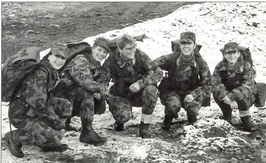
Moderne Ausrüstung, zukunftsweisende Ausbildung, der Schritt vom RKD in die Armee XXI wird Wirklichkeit, und gleich bleibend bildet die gute Kameradschaft ein zentrales Erlebnis.

ein Gesetz in Kraft. Das hier sichtbare Zusammenspiel der Geschlechter zeigt, dass die Zeit an der Wende vom 19. zum 20. Jahrhundert moderner war als unsere Gegenwart gelegentlich wahrhaben will. In seltener Einmütigkeit wurde ein Gesetz verabschiedet, dessen Ertrag unser Land heute noch besitzt: den Rotkreuzdienst. Kein anderer Teil der Armee hat im Ernstfall so viele Angehörige verloren wie der Rotkreuzdienst. In der Grippeepidemie von 1918 starben 69 Frauen des Rotkreuzdienstes in der Erfüllung ihrer Pflicht für die Soldaten, für das Vaterland. Kein anderer Teil der schweizerischen Armee hat so früh das praktiziert, was wir heute Sicherheit durch Kooperation nennen. Wenn der gute Geist des Rotkreuzdienstes weiterlebt, werden in weiteren hundert Jahren andere Generationen wieder hier stehen, voller Stolz auf eine grosse Sache, auf den Rotkreuzdienst!