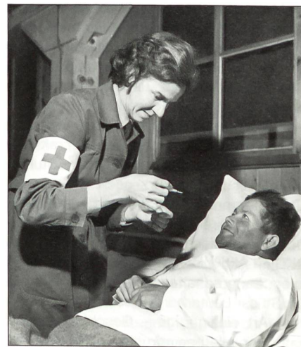
Die Pflege bettlägeriger Soldaten gehörte von Anfang an zu den klassischen Aufgaben der RKD-Angehörigen.

Bundesrat Samuel Schmid blendete in seinem Gratulationsreferat zurück zur Grün-