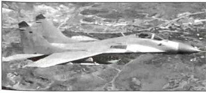
Das Jagdflugzeug MiG-29 (FULCRUM).

Bestand der Bundeswehr erhalten. Die restlichen auf NATO-Standard gebrachten Flugzeuge werden bis Mitte des Jahres 2004 folgen. Das ist eine Auswirkung der engen Zusammenarbeit Polens und Deutschlands, insbesondere auf dem Gebiet der Sicherheitspolitik.