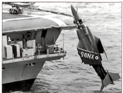
Buccaneer der Fleet Air Arm.

Bei unten stehendem Bild wird im Rahmen einer Übung an Bord des britischen Flugzeugträgers H.M.S. Ark Royal die Bergung von Besatzungsmitgliedern aus havarierten Flugzeugen geübt. In diesem Fall handelt es sich um ein Tiefangriffsflugzeug des Typs Blackburn Buccaneer der Royal Navy.