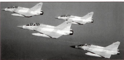
Dassault Mirage 2000-9 der United Arab Emirates Air Force.

Von den bei Dassault im Jahr 1998 bestellten 32 neuen Kampfflugzeugen vom Typ Mirage 2000-9 wurden bisher mindestens deren 10 an die United Arab Emirates Air Force abgeliefert.