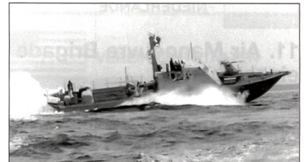
Das neue Schnellboot «Super Dvora» Mk.III.

Dieser Auftrag war Teil eines 40-Millionen-US-Dollar-Flotten-Modernisierungsprogramms. Es sieht die Ersetzung der alten «Dvora»-Klasse FPB durch neue «Shaldag» II (von Israel Shipyards) und «Super Dvora» Mk.III (von IAI/Ramta) vor. Beide Bootstypen sind schneller als alle