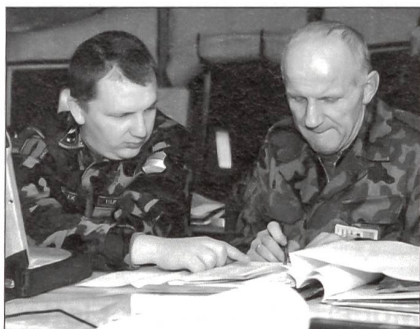
Stabsoffiziere des ARRC aus Polen (rechts) und Ungarn.

Das fiktive Übungsszenario galt geografisch dem Nahen Osten und band verschiedene vergleichbare Konflikte aus der gesamten Welt mit ein. Als erstes und am meisten erfahrenen von den sechs hoch einsatzbereiten Hauptquartieren der NATO-Landstreitkräfte spielte ARRC stets eine besondere Rolle in Militäroperationen der NATO. Rene