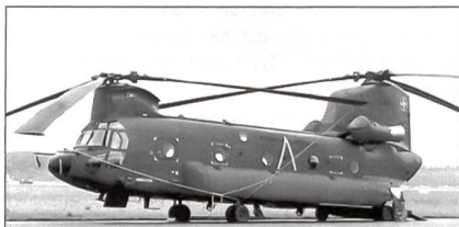
Transporthubschrauber CH-47 «Chinook».

Die Niederlande haben eine «Air Manoeuvre Brigade» – 11(NL)AMB-geschaffen, die sich aus der «Airmobile Brigade» (2400 Personen, stationiert in Schaarsbergen und Assen) der Landstreitkräfte und der «Tactical Helicopter Group» der Luftstreitkräfte (mit Kampf- und Transporthubschraubern, stationiert in Gilze-Rijen und Soesterberg) zusammensetzt. Die Kampfhubschrauber