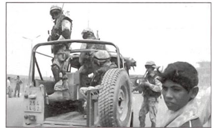
Tschechien hat mit seinen ABC-Abwehrkräften in Kuwait Einsatzerfahrung gesammelt.

Auf dem Prager NATO-Gipfel im Jahr 2002 wurde beschlossen, ein Internationales Bataillon für die Atomare-, Biologische- und Chemische-Abwehr für die NATO bereitzustellen. Tschechien hat sich mit seinen bereits im Nahen Osten gemachten Erfahrungen bereit erklärt, dieses Bataillon aufzustellen, erwartet jedoch die Unterstützung aller Alliierten.