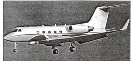
C-20C der USAF.

Für den undenkbaren Fall eines Nuklearkrieges sind auf der Andrews AFB, Maryland, USA, drei Kleintransporter vom Typ C-20C stationiert. Sie werden bereitgehalten für die Evakuierung wichtiger Entscheidungsträger/-innen.