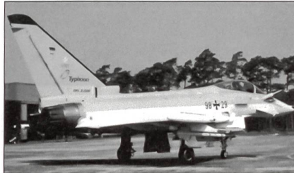
Eurofighter Typhoon der Bundesluftwaffe.

Die Lieferung von 18 Eurofighter Typhoon soll in den Jahren 2007–2009 erfolgen. Im Rahmen einer Übergangslösung wird die Miete von sechs bis zwölf Kampfflugzeugen dieses Typs erwogen.