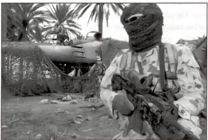
In einem Wald versteckte MiG-25 Foxbat der irakischen Luftwaffe nach der Entdeckung durch Special Forces.

Auf der Suche nach verborgenen Waffen stießen die Amerikaner auf in der Wüste vergrabene Suchoi SU-25 Frogfoot und MiG-25 Foxbat. Gleiche Kampfflugzeuge wurden aber auch – vorzüglich getarnt – in Wäldern gefunden.