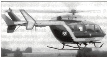
Eurocopter EC 145 der Gendarmerie Nationale.

Die Gendarmerie Nationale ersetzt ihre 40-jährigen Sud Aviation Alouette III nach und nach durch den leichten Mehrzweckhubschrauber Eurocopter EC 145.