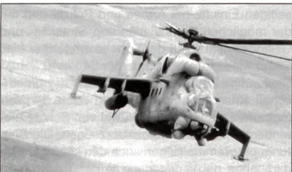
Mil Mi-24V Hind.

British Aerospace Systems ist auch engagiert bei Kampfwertsteigerungsprogrammen von Hubschraubern östlicher Herkunft, beispielsweise beim Transporthubschrauber Mil Mi-172 Hip und beim Kampfhelikopter Mil Mi-24 Hind.