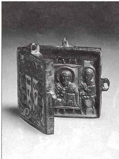
Russische Ikone, Fund aus der Schanze Schaarenwald 1799 (Foto: Kantonales Amt für Archäologie, Frauenfeld).

Im Frühjahr 1800 entschloss sich Frankreich, mit rund 100 000 Mann unter General Moreau über den Rhein Richtung Norden stossend in den süddeutschen Raum einzudringen und die Österreicher zu einem Frieden zu zwingen. Rund 35 000 Mann sollten unter dem Befehl von General Lecourbe über den ehemaligen Brückenkopf im Schaarenwald ans nördliche Rheinufer gelangen. Die immer noch in Büsingen festgekrallten Österreicher zwangen ihn jedoch zu einem Täuschungsmanöver: Mit wenigen Truppen machte er den Feind glauben, der Hauptangriff erfolge wiederum aus dem