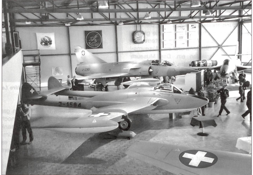
Blick in die Ausstellungshalle von der Galerie aus.

Mit vorzüglichen Rück- und Ausblicken würdigten die Referenten die Entstehung des Werkes und freuten sich an der gefeierten Verwirklichung. Die Geräuschkulisse lieferten die Kampfflugzeuge, die draussen starteten und landeten. Nach