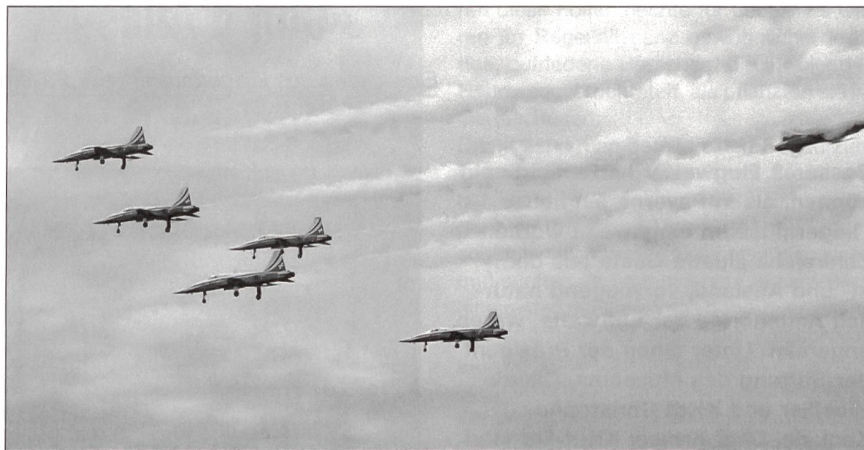
Das Tunnel, eine besonders spektakuläre Leistung der Patrouille Suisse.

Nach dem Essen fuhren alle hinaus auf die Flugfelder. Am Rande der Piste liessen wir uns nieder wie in einer Arena. Die Weitsicht war fantastisch. Die nun folgenden Darbietungen wurden zweisprachig kommentiert. Auf die Sekunde genau tauchten die