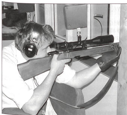
Im Erdgeschoss schiessen Jäger auf Distanzen von 150 und 100 Metern.

rege und erfolgreich benützt worden. Die Weltneuheit «Brünig Indoor» ist ein Kompetenzzentrum für alle Schützen. Die Idee, lärmfrei zu schiessen, ist nicht neu. Schiesszeiten werden an vielen Orten eingeschränkt, aus verschiedenen Gründen (z.B. Bundesgesetz über den Umweltschutz und Lärmschutzverordnung) mussten in den letzten Jahren massenhaft Anlagen geschlossen werden, einige konnten mit grossen Investitionen den neuen