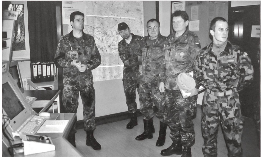
Einweisung von Reservisten ins SIRA.

Im Rahmen einer dienstlichen Veranstaltung für Reservisten der Bundeswehr konnten Schweizer Offiziere und Unteroffiziere den Ausbildungsstützpunkt Ellwangen besuchen. In der Reinhardt-Kaserne