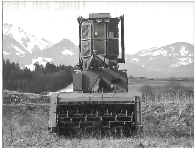
MineWolf von RUAG Land Systems Einsatz mit Schlegel ...