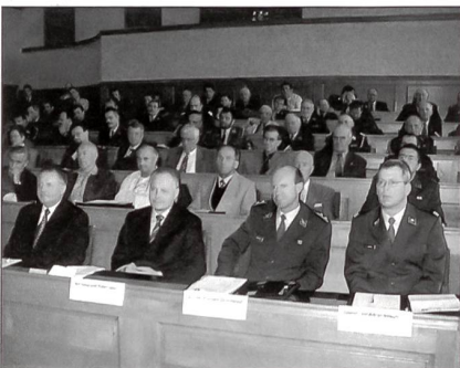
Interessierte Ehrengäste aus Politik und Militär.