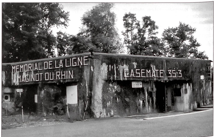
Am Eingang zum Bunker und zum kleinen Museum.

Wie an einem Sternmarsch trafen die Angemeldeten aus allen Richtungen der