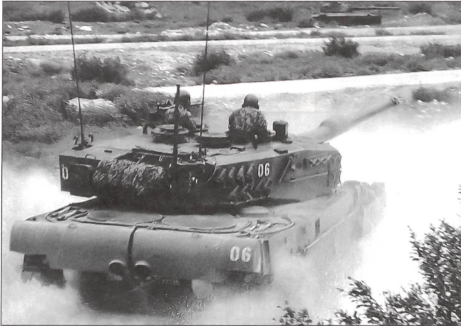
Demonstration der ausgezeichneten Beweglichkeit des Leopard-Panzers im Gelände.

kurze Nacht gehabt hätten! Am Morgen fand eine rund zweistündige Führung durch die ganze Festungsanlage statt. Alle waren tief beeindruckt von der Grösse der tief im Fels angelegten Festung mit eigener Wasserversorgung und Stromerzeugung. Die damaligen Gegner, wären sie in unfreundlicher Absicht über den Splügenpass in die Schweiz eingefallen, hätten sich wohl am Artilleriefort Crestawald die Zähne ausgebissen. In der heutigen Armee werden Festungen wie Crestawald nicht mehr gebraucht. Beweglichkeit ist heute Trumpf und deshalb sind starre Sperren keine wirklichen Sperren mehr. Als «Zeitzeuge» einer starken Sperre im Zweiten Weltkrieg hat das Artilleriewerk Crestawald seine Bedeutung aber nicht verloren.