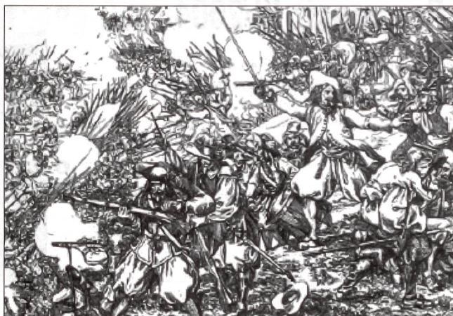
Das Gefecht von Wohlenschwil vom 24. Mai/3. Juni 1653.

Angesichts der Geschütze des Tagsatzungsheeres verlässt sie jedoch der Mut. Der Mellingervertrag vom 4. Juni 1653 bestätigt die Unterwerfung der aufständischen Bauern. Ohne Zusicherung der Straflosigkeit lösen sich die Bauernverbände auf. Die bernische Regierung – entschlossen, alles zu gewähren und nur das zu halten, was ihr beliebt – sendet 7000 Welsche unter der Führung von General Sigmund von Erlach in den Oberaargau. Bei Herzogenbuchsee bricht er am 8. Juni 1653 den letzten Widerstand der Rebellen, die sich besser schlagen als von ihm erwartet. Der Ruf als «Bauernschlächter» bleibt ihm erhalten.