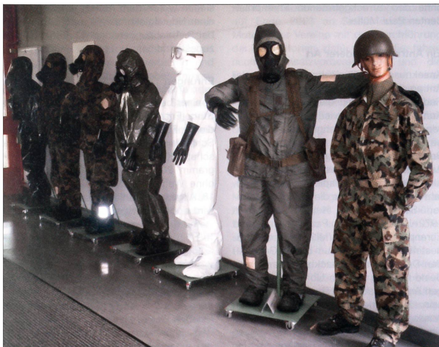
Modeschau für gefährliche Arbeiten.