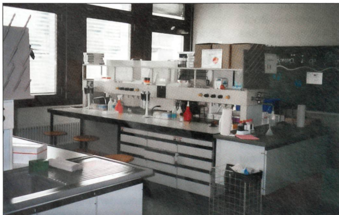
Ruhe vor dem Sturm – ein Übungslaboratorium im ABC-Kompetenzzentrum.

Am 26. April 2004 haben die ersten 31 Rekruten im Kompetenzzentrum ABC der Armee in Spiez die Fachdienstausbildung begonnen. Die Rekruten begannen die Allgemeine Grundausbildung (AGA), die für alle Angehörigen der Armee dieselbe ist, am 15. März bei der Elektromechaniker-Rekrutenschule des Lehrverbandes Logistik 2 in Lyss.