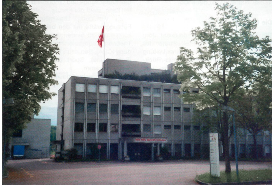
Die Zentrale der militärischen ABC-Abwehr.

Auf 1. 1. 2004 ist in der Schweizer Armee eine neue Waffengattung, die ABC-Abwehrtruppen, eingeführt worden. Seit dem 26. April haben die ersten Rekruten und