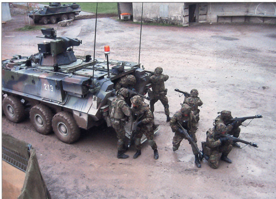
Füsiliergruppe im Einsatz.

bei scharfer Bise und beissender Kälte einen tadellosen Eindruck.