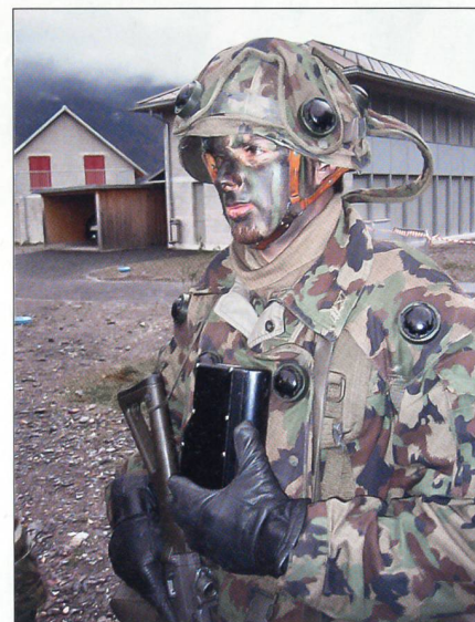
Füsilier mit Simulationsgerät.