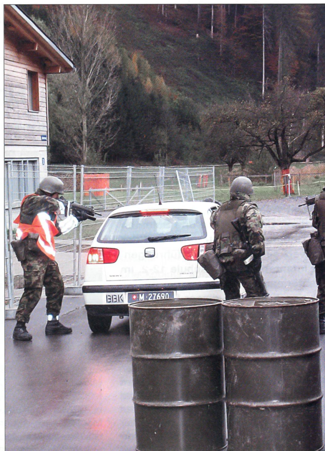
Kampf an der Strassensperre.