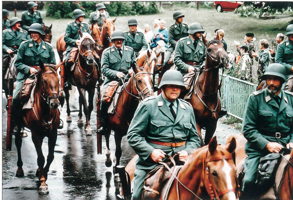
Vorbeimarsch der Kavallerieschwadron 1972.

Im Feldlager der Schweizer Kavallerieschwadron 1972 eingangs Elm herrscht Hochbetrieb. Dragoner kehren von einem anspruchsvollen Patrouillenritt zurück. Sie