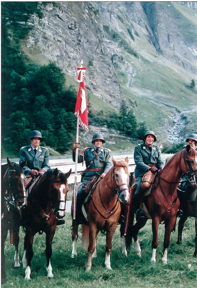
Die Standarte der Kavallerieschwadron 1972 wird präsentiert.

*Adolf Meier: «Das letzte Defilee», ISBN 3-85504-135-0, erschienen 1991 im Weltwoche-ABC-Verlag, Zürich