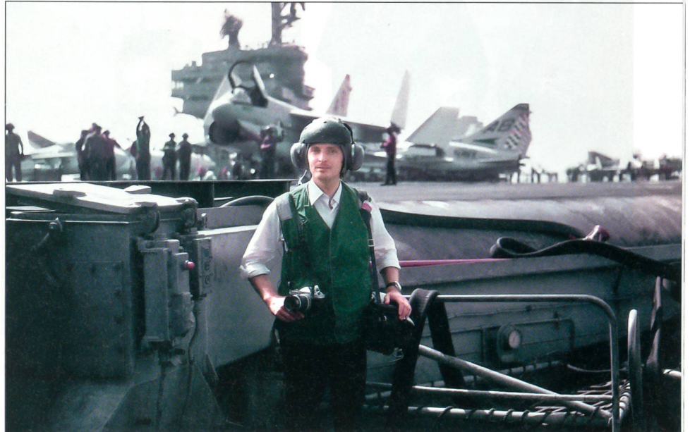
Einwöchiger Besuch auf dem Flugzeugträger USS John F. Kennedy (CVA-67) im Sommer 1973 irgendwo zwischen Barcelona und Malta. Der hektische und nicht ungefährliche Flugbetrieb auf dem lärmigen Flugdeck konnte auch vom «Catwalk» aus, dem «Gehsteig» rund um das Flugdeck, beobachtet werden.

dieses aus einer Mischung des Neuen, des Unbekannten, der beeindruckenden Technologie und des Hauches von der grossen weiten Welt entstanden ist. Bedauert hat er es jedenfalls nie. Es hat ihm Welten und Regionen erschlossen, die er sonst wohl nie zu sehen bekommen hätte. Und es hat zu persönlichen Begegnungen geführt, die einzigartig sind. Allen jungen Leuten möchte ich diesen Rat auf den Weg geben: Auch bei Hobbies ist die Pflege von Bekanntschaften etwas vom wichtigsten, nicht nur, weil sie bereichernd sind, sondern weil solche Kontakte immer wieder neue Türen öffnen. Auch ein Hobby muss bewirtschaftet werden, wachsen, sich entwickeln und neue Herausforderungen annehmen. Sonst wird es langweilig.