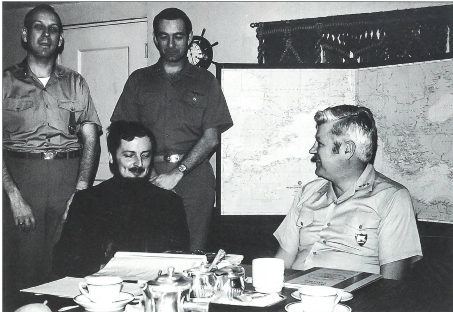
Vizeadmiral Harry D. Train, II, Kommandant der 6. US-Flotte, empfängt den Mitarbeiter des «Schweizer Soldat» auf dem Flaggschiff und Raketenkreuzer USS Albany (CG-10). Train wurde kurz darauf zum Viersternadmiral und NATO-Oberbefehlshaber Atlantik ernannt.

des abwesenden Admirals zugeteilt, und früh am nächsten Morgen lichtete der Träger die Anker. Im Hintergrund entschwand langsam der Apennin. Dann wurde der Kantischüler aus Solothurn im Thyrrischen Meer erstmals Zeuge von Seeoperationen. Umgeben von Zerstörern begannen auf dem Deck der USS Shangri La Flugoperationen, über die er damals erstmals im Schweizer Soldat berichtete. Drei Tage später und erschlagen von den Eindrücken wurde unser «Marinejournalist» in ein C-1A Trader Flugzeug gepackt, welches ohne Katapulthilfe startete und ihn nach Nizza brachte.