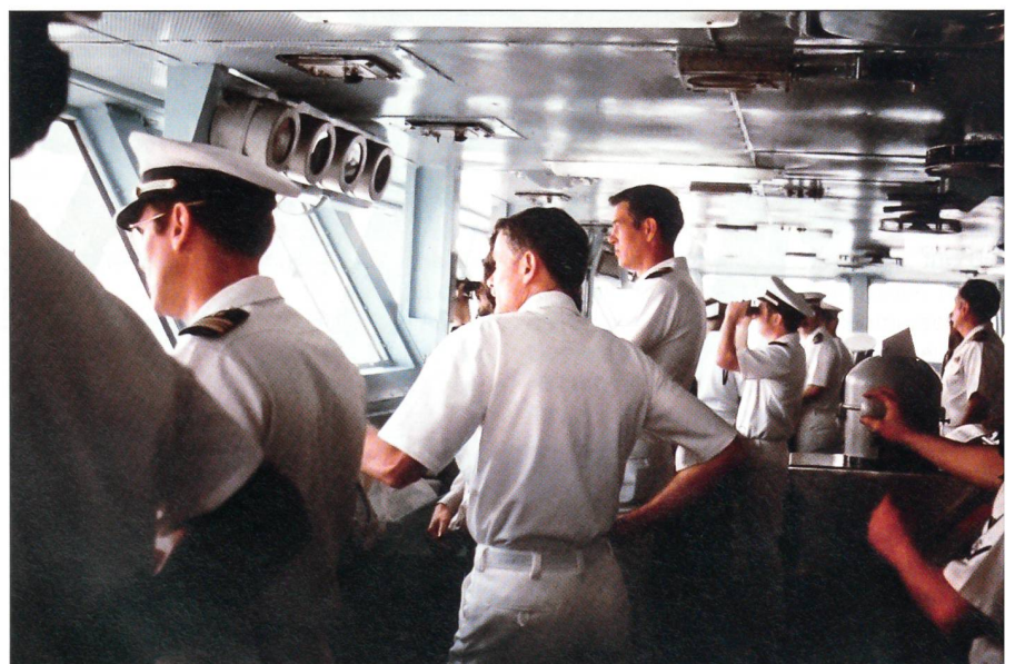
Auf Einladung des Kommandanten des Atomflugzeugträgers USS Nimitz (CVN-68), Captain John Batzler, konnte im Mai 1981 der Flugzeugträger vor der Küste Virginias im Atlantik besucht werden. Auf der Brücke ist hinten Captain Batzler erkennbar.