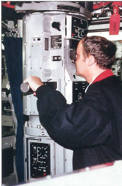
Am Periskop des Atom-U-Bootes USS Boise (SSN-764).

Kreuzer USS Albany (CG 10) oder der Besuch auf dem britischen Zerstörer HMS Sheffield in Rotterdam kurz vor dessen Versenkung im Falkland-Krieg bleiben ihm in ganz besonderer Erinnerung. Kidds Vater war auf dem Schlachtschiff USS Arizona am 7. Dezember 1941 beim Angriff der Japaner auf Pearl Harbor ums Leben gekommen; - Und so liesse sich noch vieles mehr über den mittlerweile erfahrenen Marinekenner des Schweizer Soldat erzählen. Unzählige Besuche und Fahrten auf See, darunter auch auf Kriegsschiffen anderer Marinen sind dazugekommen; - Als Nächstes plant Jürg Kürsener einen