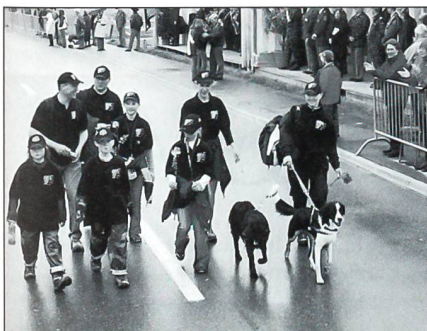
Eine zivile jugendliche Gruppe beim Einmarsch.

Das Organisationskomitee unter der Leitung von Nationalrat Rudolf Joder hat grosse Arbeit geleistet. Praktisch alle Ressortverantwortlichen waren sehr stark gefordert, da durch die anfäng-