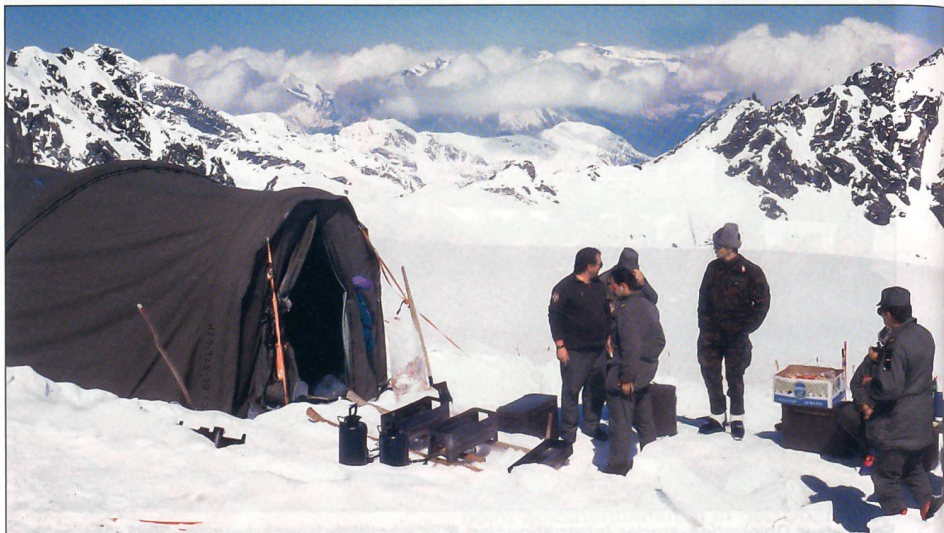
Basislager einer Gebirgsgrenadierkompanie.

Der Mensch der Urzeit hatte kein Verhältnis zum leblosen Eis und Fels. Er sah die Berge höchstens aus der Ferne, weil er ja da lebte, wo die Erde für ihn fruchtbar und wohnlich war. Der Berg erregte Furcht, Schrecken und Angst. Er galt als die geeignete Wohnstätte der Götter und der Ort für göttliche Offenbarungen. In den ältesten Zeiten der Menschheitsgeschichte waren die Berge das grosse Niemandland.