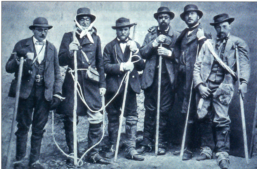
Bergführer um 1880.

zember 1888, als Nachfolger der Chasseurs à pied der Dauphin-Milizeinheiten. Die Vorläufer der schweizerischen Gebirgstruppen waren die kantonalen Alpenjäger der Gebirgskantone. Im Jahre 1877 wurden die Gebirgsartillerie und 1890 die Festungsartilleriekompanien eingeführt. Mit diesen eidgenössischen Truppen begann auch die militärische Gebirgsausbildung in vollem Bewusstsein, dass das Leben im Gebirge hart ist, und wer dort zu bestehen hatte, musste entsprechend ausgebildet werden.