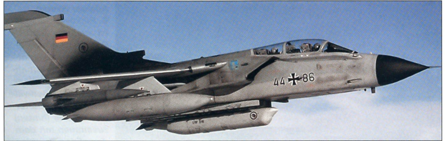
Aufklärer mit Recce Pod am Rumpf.

Im Irak-Krieg von 1991 bewährten sich britische und italienische Tornados im Kampf. Im Sommer 1995 setzte die Bundeswehr den Tornado auf dem Balkan ein; zum Einsatz gelangten der Aufklärer und die auf den elektronischen Kampf ausgelegte Variante. Der Tornado war das erste deutsche Kampfflugzeug, das nach dem Zweiten Weltkrieg in einem bewaffneten Konflikt eingesetzt wurde.