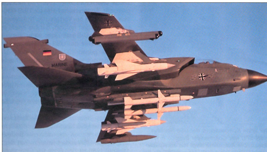
Ein Marine-Tornado mit Kampfbeladung: Zwei Anti-Radar-Raketen am Rumpf und zwei Anti-Schiff-Raketen unter den Tragflächen.