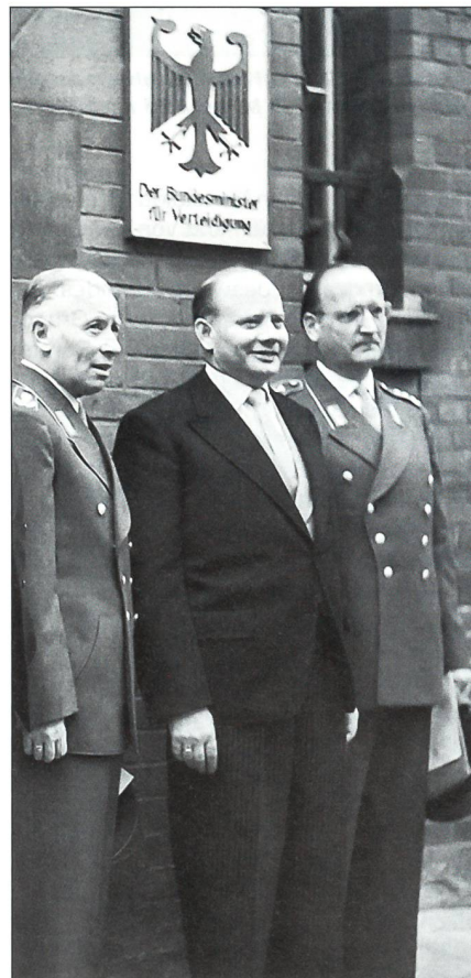
Ein völlig neues Kapitel in der Geschichte deutscher Streitkräfte hat begonnen: Bundesverteidigungsminister Theodor Blank, flankiert von den frisch berufenen Bundeswehrgenerälen Adolf Heusinger und Alfred Speidel, vor dem Bundesverteidigungsministerium in Bonn nach der Ernennung der ersten 101 Soldaten am 12. November 1955 in der Ermekeilkasernen.

Mai 1974 Bundeskanzler wurde, folgte ihm Georg Leber auf die Hardthöhe. Die neue Politik hatte kaum Einfluss auf das Militär. Die Einbindung in die NATO und die Erfordernisse der Verteidigungsfähigkeit gegenüber den massiven Kräften des Warschauer Paktes liessen das nicht zu.