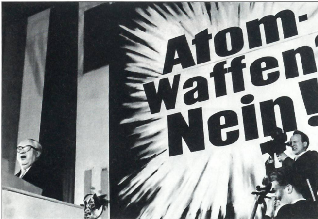
Veranstaltung gegen die nukleare Bewaffnung der Bundeswehr Ende der 50er-Jahre: «Der Protestbewegung 'Kampf dem Atomtod' seinerzeit habe ich als junger Mensch aus tiefster Überzeugung angehört.»

Der erste Grossauftrag für ein Waffensystem des Heeres war der Lizenzbau für den Schützenpanzer HS 30, ein mit grossen Mängeln belastetes Fahrzeug. Die deutsche Rüstungsindustrie entwickelte sich wieder und hat im Laufe der Jahre Waffensysteme wie den Kampfpanzer LEOPARD, den Jagdpanzer JAGUAR, den Flugabwehrpanzer GEPARD, den Aufklärungspanzer LUCHS, den Spürpanzer FUCHS und anderes Grossgerät geliefert.