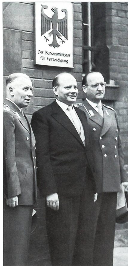
Ein völlig neues Kapitel in der Geschichte deutscher Streitkräfte hat begonnen: Bundesverteidigungsminister Theodor Blank, flankiert von den frisch berufenen Bundeswehrgenerälen Adolf Heusinger und Alfred Speidel, vor dem Bundesverteidigungsministerium in Bonn nach der Ernennung der ersten 101 Soldaten am 12. November 1955 in der Ermeikeilkaserne.

Mai 1974 Bundeskanzler wurde, folgte ihm Georg Leber auf die Hardthöhe. Die neue Politik hatte kaum Einfluss auf das Militär. Die Einbindung in die NATO und die Erfordernisse der Verteidigungsfähigkeit gegenüber den massiven Kräften des Warschauer Paktes liessen das nicht zu.