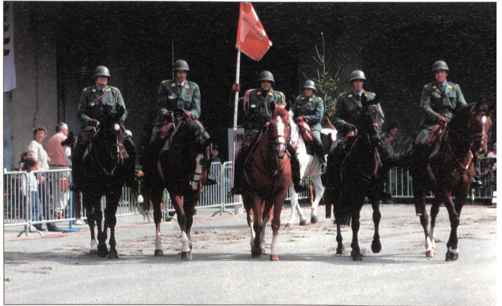
Das Einreiten der Schwadron war eindrucksvoll.