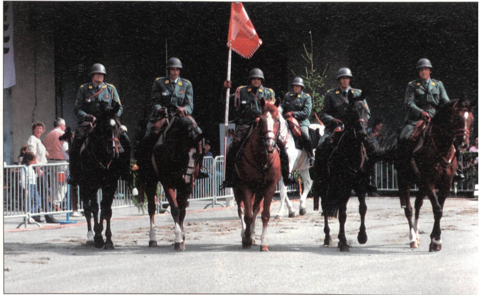
Das Einreiten der Schwadron war eindrucksvoll.