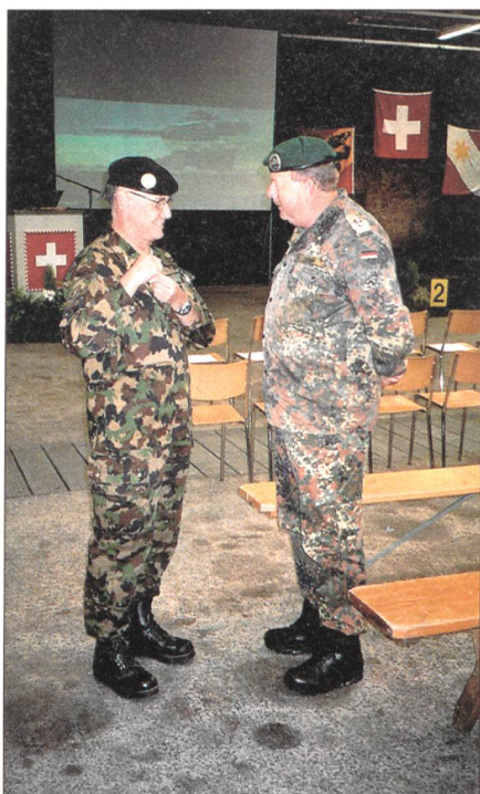
Brigadier Fred Heer, Projektleiter STC05, im Gespräch mit einem Vertreter der deutschen Delegation.

Kategorie III (Schweizer und Gäste): Nach harten Kämpfen siegte Deutschland vor Polen, den Schweizern der cp chars 18/4 mit plt Schwab, sdt chars Matter und von Büren. Vierter wurde Dänemark. Wie im Jahre 2004 konnte wiederum eine Schweizer Besatzung vorne mitmischen. Nach der Aussage des Kommandanten des Lehrverbandes Panzer 3 zeige dies deutlich, dass die Ausbildung und das Leistungsvermögen auch in der Armee XXI vorbildlich seien.