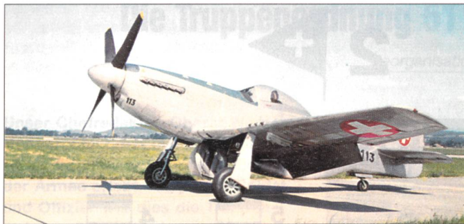
Ende der 40er-Jahre wurden aus amerikanischen Restbeständen des 2. Weltkrieges 130 P-51 D Mustang-Jagdflugzeuge beschafft