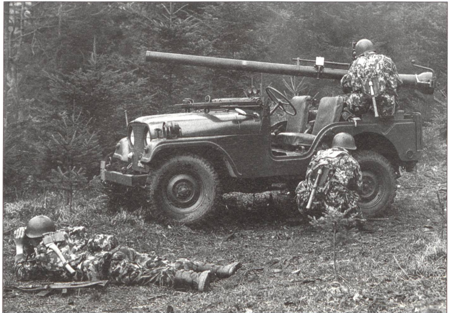
Im Rahmen der TO 51 wurden auch rückstossfreie Geschütze (BAT) des Kalibers 106 mm beschafft. Sie waren noch in der TO 61 vor allem in der Panzerabwehrkompanie der (Mot) Inf Rgt eingeteilt und auf dem Jeep montiert.

Berlin durch die Sowjets 1948, die gewaltsame Errichtung kommunistischer Regimes in Osteuropa sowie von der Sowjetunion unterstützte Versuche zur Machtübernahme in Griechenland und Drohgebärden gegenüber der Türkei offenbarten, dass die Lage nach dem Krieg alles andere als friedlich war. Das Kriegsende hatte keine bleibende stabile Lage geschaffen, im Gegenteil. Die Spaltung Deutschlands in einen demokratisch ausgerichteten westlichen und in einen totalitären, von den Sowjets kontrollierten Teil, zementierten die völlig unterschiedlichen Systeme im Osten und Westen Europas. Hinzu kam schliesslich der Ausbruch des Koreakrieges im Juni 1950, der im Westen wie ein Schock wirkte und die weltweiten Machtansprüche beziehungsweise Beeinflussungsversuche der Sowjets deutlich unterstrich. Der 2. Weltkrieg war zwar beendet, aber nach diesem «heissen» Krieg schien nun der Kalte Krieg