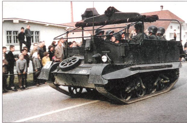
Zur Beschaffung von neuem Material gehörten auch die ersten «Schützenpanzer», die UC (für Universal Carriers). Von diesen wurden zu günstigen Bedingungen 300 Stück aus Nachkriegsbeständen der Siegermächte gekauft. Sie waren auch noch in den Anfängen der TO 61 eingeteilt (hier anlässlich des Defilees des verstärkten Mot Inf Rgt 11 im April 1963 in Solothurn).

In diese bewegte Zeit der TO 51 fallen im Übrigen auch andere interessante Ereignisse: 1953 wurden nach Abschluss des Koreakrieges gegen 100 Schweizer Offiziere als Überwacher der Waffenstillstandskommission (NNSC) nach Panmunjon geschickt, in der Fliegerabwehr wurde 1958