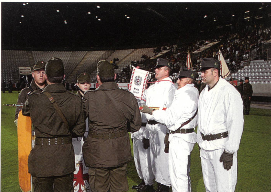
Vier der 1250 Rekruten geloben stellvertretend für ihre Kameraden die Treue zu Regiment, Fahne und Nation.

6. Jägerbrigade sind dies die Tiroler Kaiserjäger, die in einer speziellen historischen Verbindung zu den gebirgsbeweglichen Verbänden stehen. Die Kaiserjäger zeichneten sich vor allem im hochalpinen Einsatz durch herausragende Leistungen aus.