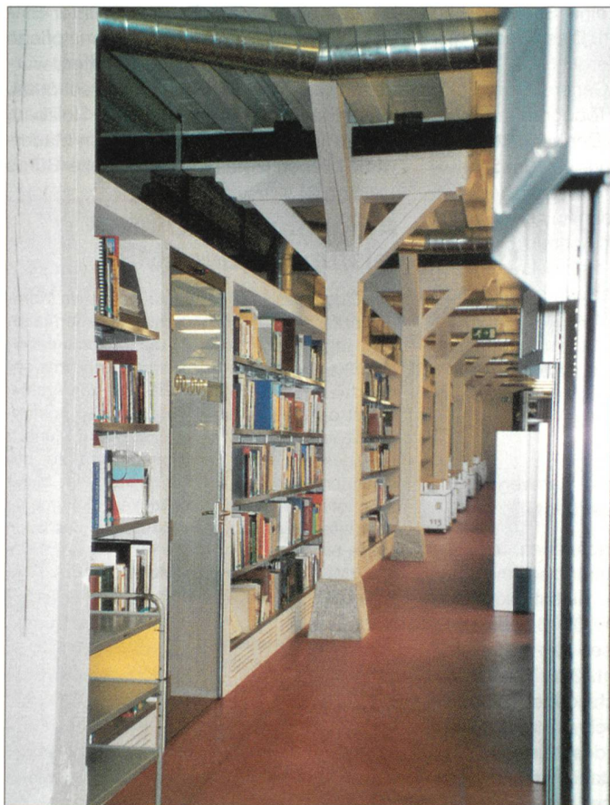
Bücherregale, soweit das Auge reicht. Die schönen alten Deckenpfeiler – die klassische «Zeughausarchitektur» – aus Holz blieben erhalten.