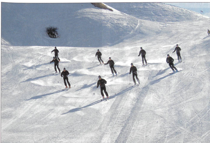
Skitechnik: Einmal Plausch!