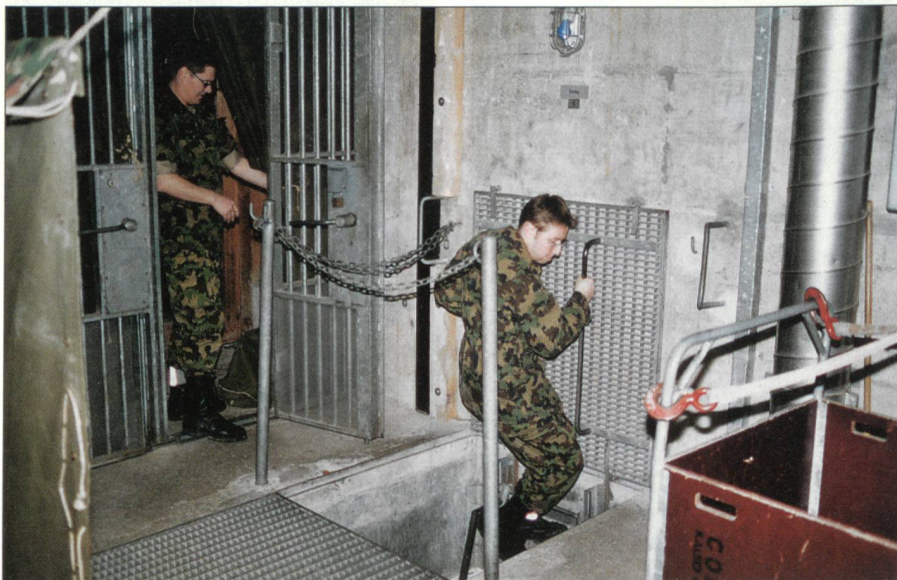
Unter der unscheinbaren Scheune verbirgt sich Hightech: Einstieg zur Vermittleranlage.