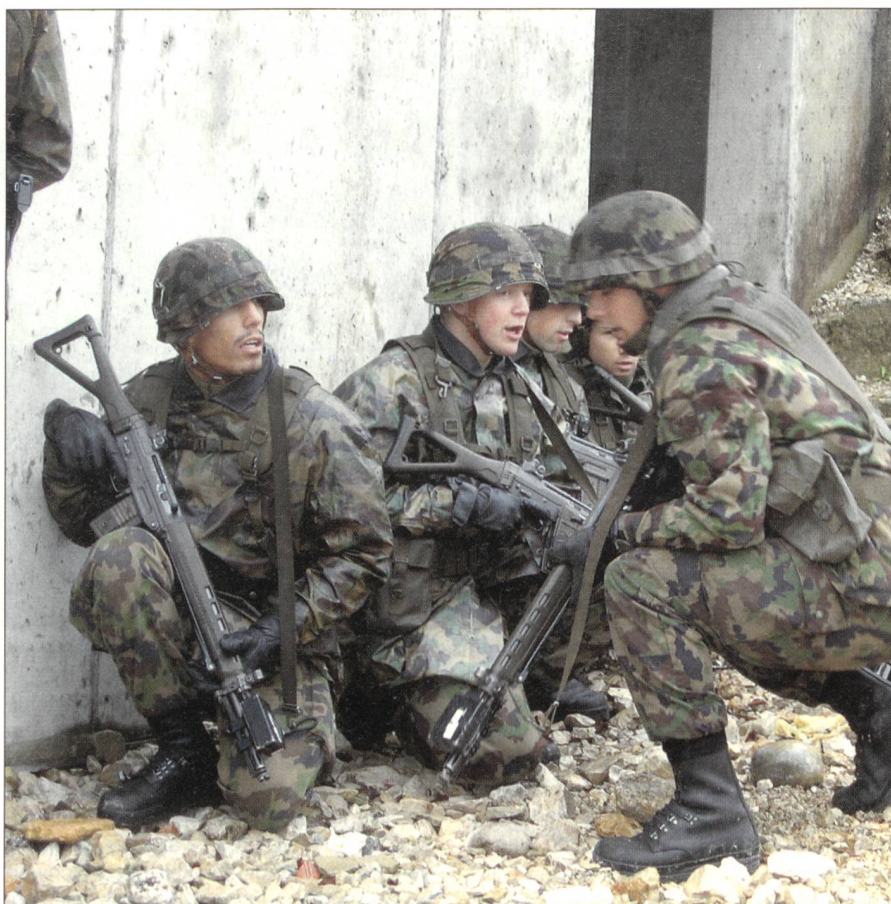
Perspektiven der Zukunft: Einsatz im überbauten Gelände.

Begründet wird der vorgeschlagene Entwicklungsschritt 2008/2011 vom VBS mit der veränderten Bedrohungslage: «Im Vordergrund der Gefahren stehen Terrorismus, Natur- und technische Katastrophen sowie Auswirkungen bewaffneter Konflikte