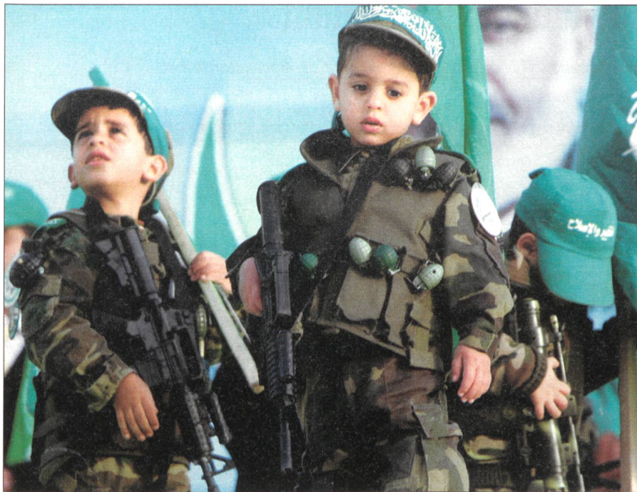
Gewaltbereiter Fundamentalismus: Kinder von Hamas-Anhängern im Gaza-Streifen.

Diejenigen Bürgerinnen und Bürger, welche die Entwicklung der Lage aufmerksam verfolgen, wissen, dass auch wir Teil dieser unsicheren und komplexen Welt sind, dass innere und äussere Sicherheit schon seit geraumer Zeit nicht mehr getrennt werden können. In der asymmetrischen Lage sind hauptsächlich die Nachrichtendienste – als erste Verteidigungslinie – zusammen mit Justiz und Polizei auf Stufe Bund, Kantone und Städte gefordert.