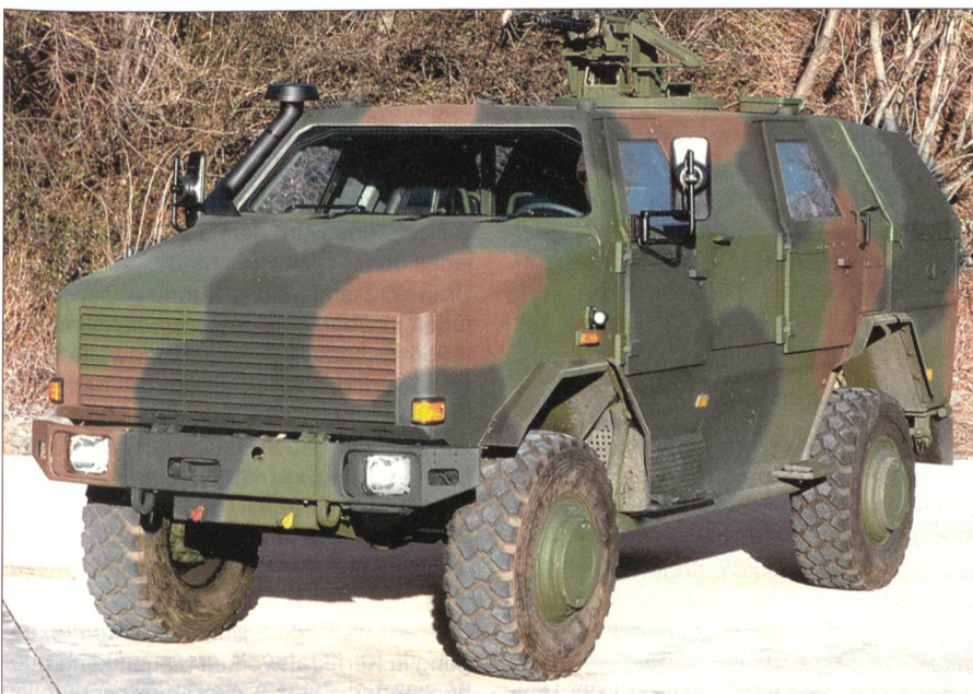
Das neue Fahrzeug Dingo 2.