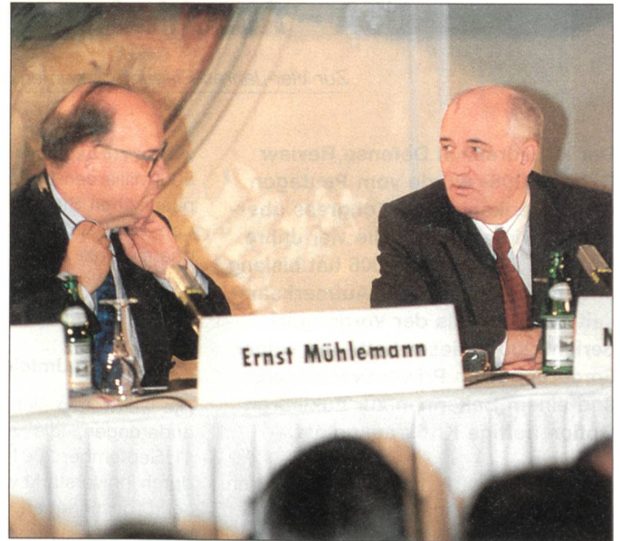
Ernst Mühlemann und Michail Gorbatschow im Hotel Bellevue in Bern.

Heute wirbt der Friedens-Nobelpreisträger mit einer Foundation in Moskau für humanitäre Aktionen und versucht gefährliche Konflikte zu entschärfen. Als Präsident des Internationalen Grünen Kreuzes kämpft Gorbatschow für die Beseitigung von Kriegsschäden und die globale Erhaltung von sauberem Wasser. Sein weltweit geschätzter Rat zur Lösung von drohenden Konflikten heisst weiterhin: «Kooperation ist besser als Konfrontation.»