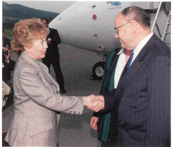
Juni 1993 auf dem Flugplatz Belp: Raissa Gorbatschowa und Ernst Mühlemann.