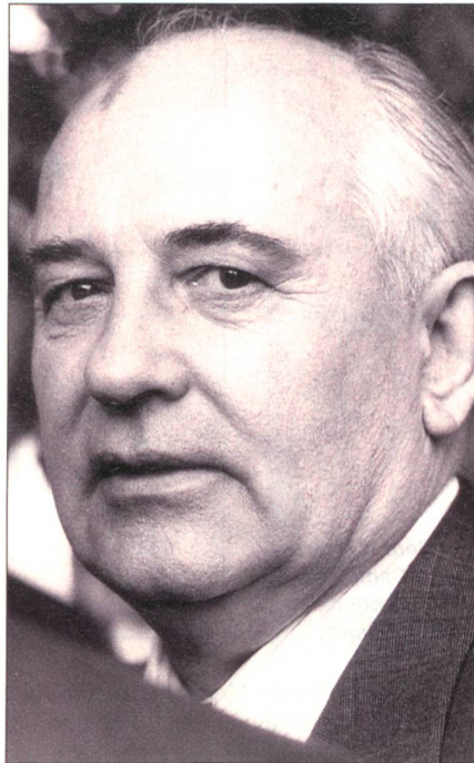
Michail Gorbatschow, einer der grossen Männer des 20. Jahrhunderts.

Die osteuropäische Wende setzte 1989 bei Gorbis Besuch in Ostberlin ein, als er den versteinerten Altkommunisten Erich Honecker mit dem berühmten Wort warnte: «Wer zu spät kommt, den bestraft das Leben.» Dank Gorbatschow erfolgte die Ablösung der kommunistischen Diktaturen