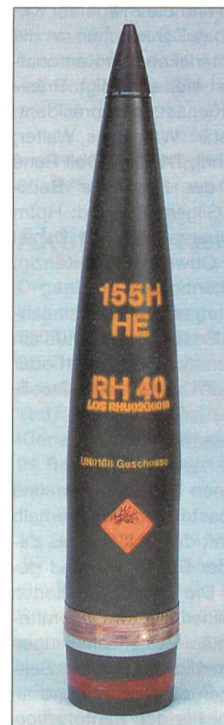
155-mm-Artilleriegeschoss für eine Reichweite von 40 km.

Im Zusammenhang mit der Abgabe von 298 Leopard 2-Kampfpanzern aus Beständen der Bundeswehr an die türkischen Streitkräfte ist Rheinmetall Defence beauftragt worden, rund 15 000 Stück Munition im Kaliber 120 mm (KE-Munition des Typs DM 63 mit zugehörigen Übungspatronen) zu liefern. Es handelt sich um so genannte Wuchtmunition auf Wolfram-Basis, die wegen ihres neuen temperaturunabhängigen Pulvers ohne Einschränkungen auch in extremen