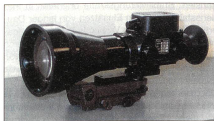
Theon Sensors NS-683C Nachtzielgerät.

Beim Nachtzielgerät handelt es sich um einen Restlichtverstärker der dritten Generation mit einer 6fachen Vergrößerung, welche für den Feldeinsatz zusätzlich gehärtet wurde.