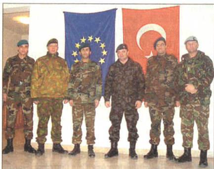
LOT der EU in Bosnien.

künften unter der lokalen Bevölkerung lebt. Insgesamt sind mehr als 40 LOT-Häuser mit ihren Teams in BiH eingesetzt.