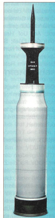
Wuchtmunition 120 mm für den Kampfpanzer Leopard 2.

Klimazonen verwendet werden kann. Der Wert der Bestellung beläuft sich auf rund 45 Mio. Euro.