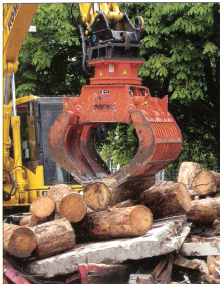
Auch schweres Gerät kommt zum Einsatz.