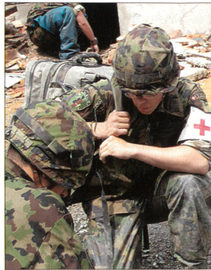
Absprache auf dem Schadensplatz.