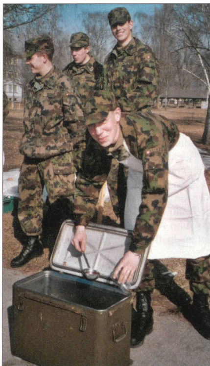
Bei so viel welschem Charme lässt man sich gerne Tee nachfüllen.