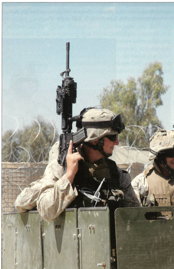
Patrouille in Ostafghanistan. Die Lage ist weder ruhig noch stabil. Feuerüberfälle sind an der Tagesordnung. Die Marines führen Kampf- und zivile Hilfsoperationen gleichzeitig durch.