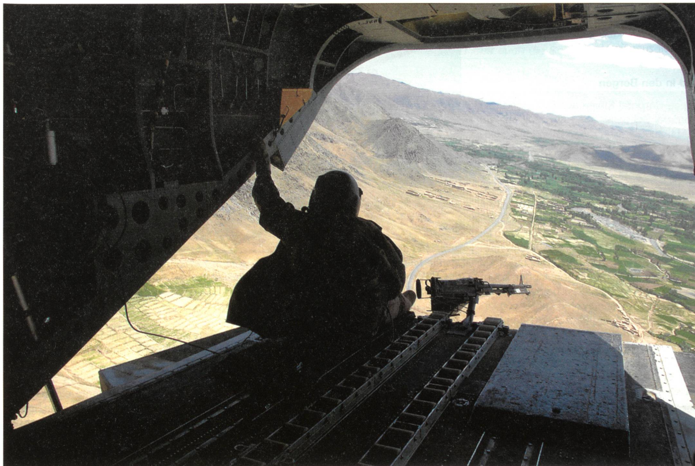
Patrouillenflug mit einer CH-47D Chinook der US-Heeresflieger von «Big Windy» über ein ostafghanisches Tal zwischen Kabul und Pakistan. Der Beobachter am Heck bedient ein schweres Maschinengewehr des Typs M60D in 7,62 mm x 51.

Marine Expeditionary Force ist auf verschiedene Basen verteilt. Zumeist sind es FOB (Forward Operating Base), also einfache Feuerbasen und Stellungen an schwer erreichbaren Plätzen.