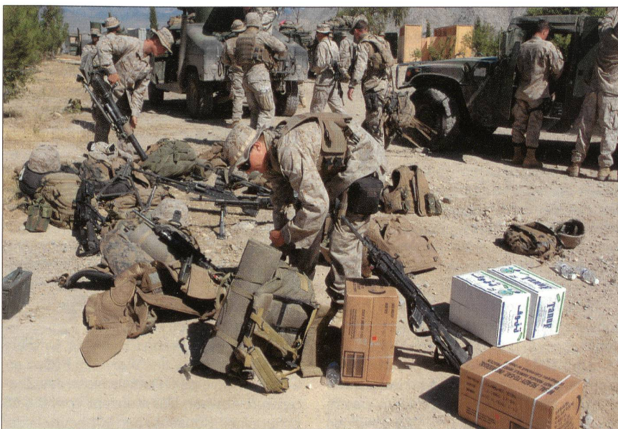
Marineinfanteristen der K10 Kompanie von 3/3 Marines bereiten sich und ihre Ausrüstung für Kampfoperationen vor. Dazu zählen Mörser, schwere Maschinengewehre und Unmengen von Munition und Wasser.

Das Bataillon ist eigentlich in Kaneohe auf Hawaii stationiert und erfüllt dort die traditionelle Wacht im Pazifik. Hier in Afghanistan ist es der Task Force Thunder zugeteilt, die eine Gruppierung verschiedener Eliteeinheiten ist und der CJTF-76 in Bagram unterstellt ist. Das Bataillon der III.