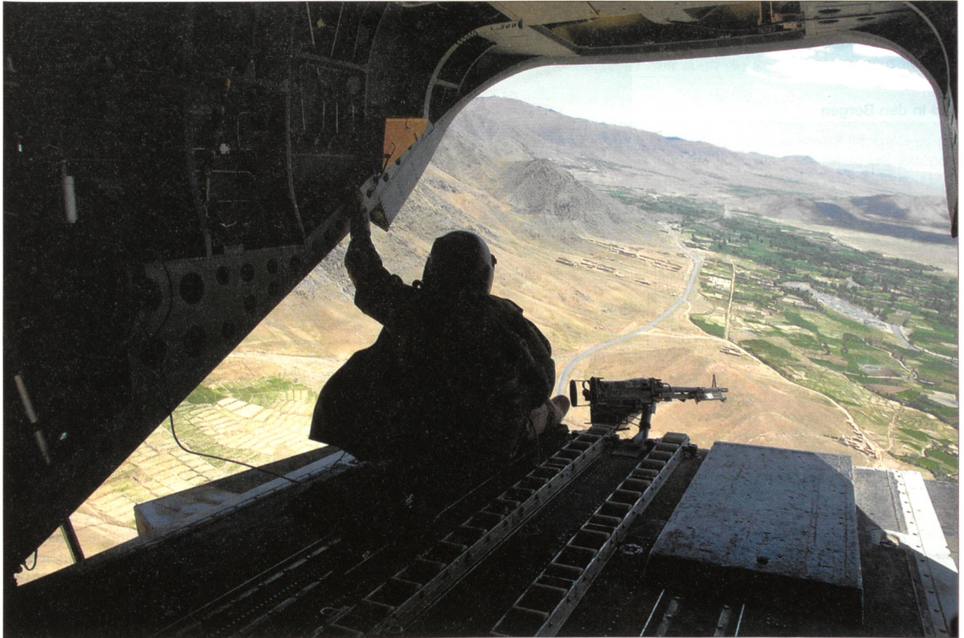
Patrouillenflug mit einer CH-47D Chinook der US-Heeresflieger von «Big Windy» über ein ostafghanisches Tal zwischen Kabul und Pakistan. Der Beobachter am Heck bedient ein schweres Maschinengewehr des Typs M60D in 7,62 mm x 51.

Marine Expeditionary Force ist auf verschiedene Basen verteilt. Zumeist sind es FOB (Forward Operating Base), also einfache Feuerbasen und Stellungen an schwer erreichbaren Plätzen.