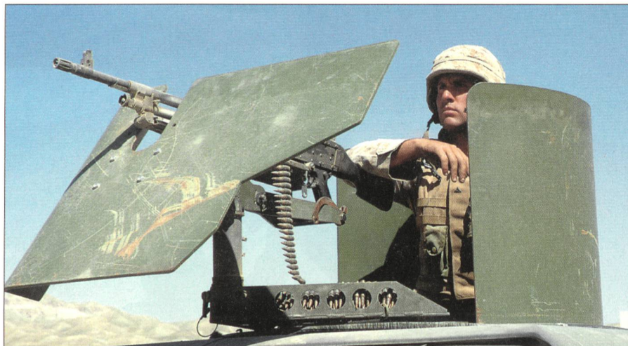
Marine-Infanterist an seinem Maschinengewehr in 7,62 mm x 51 auf der Waffenstation des HMMWV (High Mobility Multipurpose Wheeled Vehicle) kurz vor dem Aufbruch zu einer Sicherheitspatrouille in Ostafghanistan.

Einige Verletzte konnten sogar gefangen genommen und ärztlich behandelt werden. Aus Vernehmungen lässt sich schliessen, dass es sich um Drogenkuriere handelte, die sich ihre Schieberouten sichern wollten. Auf die Frage, ob die Operationen wie