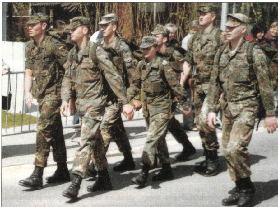
Am Ziel nach 40 Kilometern: Gäste aus Deutschland.

Bereits zum fünften Mal waren Ausgangspunkt und Ziel in Belp bei Bern. Die Zahl der Teilnehmerinnen und Teilnehmer konnte mit rund 3000 gegenüber dem Vorjahr gehalten werden. Alle, die nach Belp