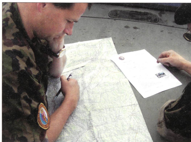
Auch Kartenlesen will gelernt sein.

Die Veranstaltung wird im Auftrag des Verbandes Schweizerischer Militär-Motorfahrer Vereine (VSMMMV) und in Zusammen-