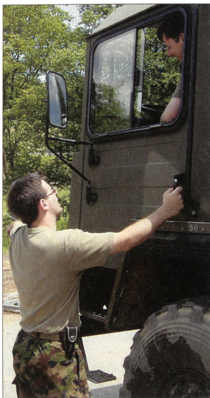
Motorfahrer arbeiten präzise.