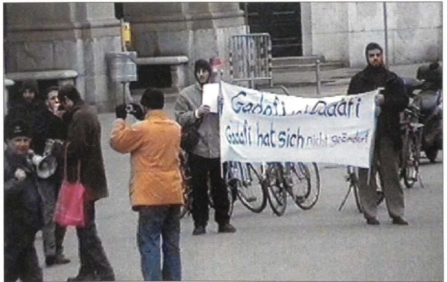
Aufforschung oppositioneller Emigranten. Das Bild stammt aus einem von der Polizei beschlagnahmten Video.

Der überholte Föderalismus in Sachen innere Sicherheit muss ein für alle Male verabschiedet werden. Auch gewisse Polizeikommandanten müssen in diesem Prozess über ihren Schatten springen. Der anerkannt sehr gut ausgebildeten und einsatzbereiten Militärischen Sicherheit muss ihr