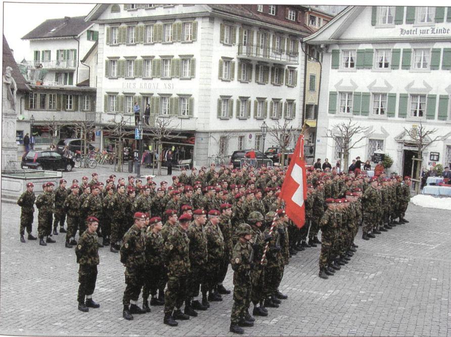
Die feierliche Verabschiedung des 14. Swisscoy-Detachementes auf dem Dorfplatz in Sarnen.

Das offerierte einfach aber gute Mittagessen schmeckte vorzüglich. «Warmer Schinken, Kartoffeln, Gemüse und Dessert.»