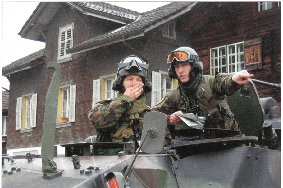
Am Kontrollposten «Sachseln».

Die SWISSCOY erledigt den Auftrag gemäss Parlamentsbeschluss vom Dezember 2001. Zum Selbstschutz darf das Kontingent kleinkalibrige Waffen (Pistole und Sturmgewehr) einsetzen. Die mechanisierte Infanterie ist ausgerüstet mit Radschützenpanzern Piranha und versieht Sicherungsaufgaben wie Campwache, Kontrollposten, Patrouillen und Konvoischutz. Der KOVOR stellt der Swisscoy einen Schweizer-Armee-Helikopter (Super Puma) für Transportflüge zur Verfügung. Dazu kommt der logistische Grundauftrag: Transport, Wasseraufbereitung, Treibstoffversorgung,