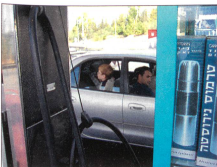
Familie auf der Flucht.