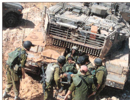
Ein Verwundeter kommt von der Front.