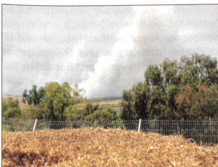
Artilleriegranaten schlagen ein.