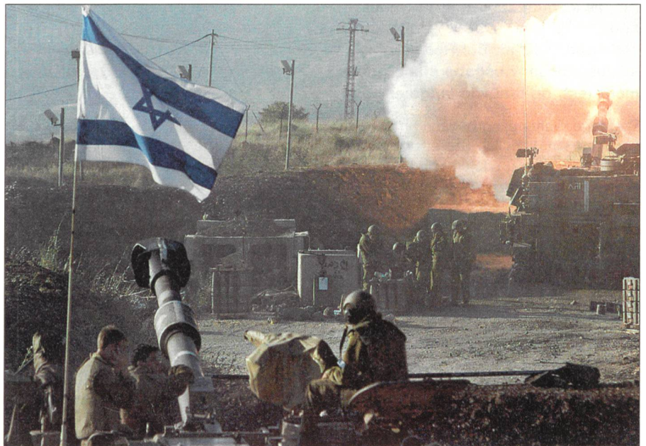
Israelische M-109-Geschützatterie: 155-Millimeter-Panzerhaubitzen in der Feuerstellung.

Im Landesinnern ist am 19. Juli dumpf die Artillerie zu hören. Es ist der erste Tag der begrenzten Bodenoffensive, in der die israelische Armee gezielte Schläge gegen Hisbollah-Stellungen im Südlibanon führt. Vom Mittelmeer bis zum Hule-Tal unterhalb der Golanhöhen hat die Artillerie ihre schweren Geschütze aufgereiht. Fast ununterbrochen nehmen die 155-, 175- und 203-Millimeter-Rohre die Hisbollah-Nester nördlich der libanesischen Grenze unter Beschuss. Die 175-Millimeter-Langrohre reichen tief ins Hinterland hinein. Beim Moschaw Avivim – dort, wo die Waffenstillstandslinie von 1948/49 den 90-Grad-Winkel nach Norden macht – ertönt scharf knatternd Infanteriefeuer, einzeln