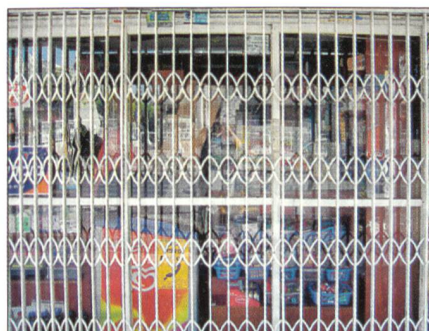
Geisterstadt Kiriat Shmona.