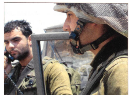
Gruppenführer und Panzergrenadier.