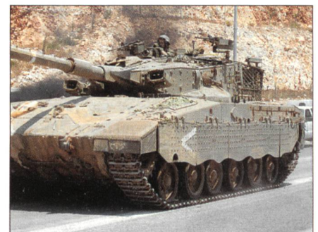
Merkawa-Panzer in voller Fahrt.