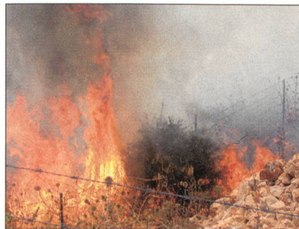
Katjuscha-Einschlag an der Strasse 899.