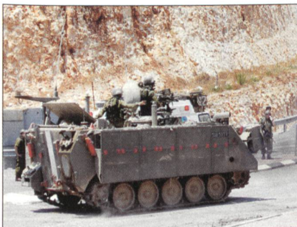
M-113-Schützenpanzer rückt vor.