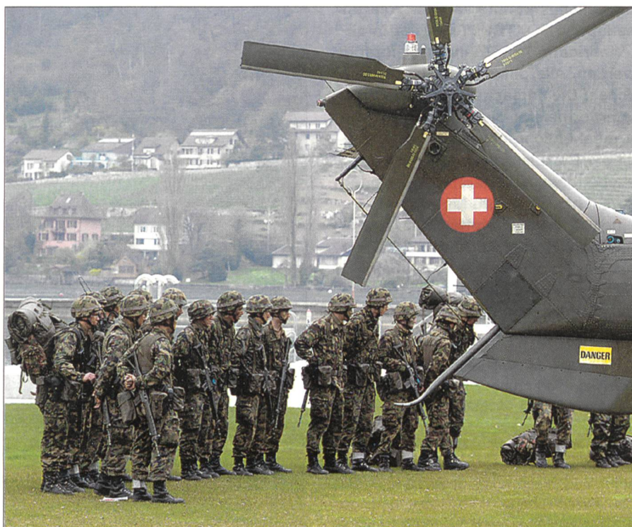
Zum Wiederholungskurs künftig ins Ausland?

Wie ein WK im Ausland aussehen würde, skizziert das VBS wie folgt: «Es werden zuerst einige Tage Vorbereitungszeit in der Schweiz zur Aktualisierung der taktischen, organisatorischen und technischen Kenntnisse des WK-Pflichtigen notwendig sein. Anschliessend wird die Verlegung auf den ausländischen Übungsplatz, die Angewöhnung an die Topografie, an das Klima und an die Einrichtungen weitere Tage benöti-